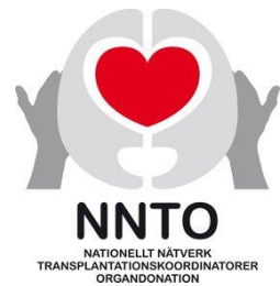
Figur 4 logga NNTO

* NNTO - Nationellt Nätverk Transplantationskoordinatorer Organdonation, är ett nätverk inom Svensk Sjuksköterskeförening, SSF. I nätverket samlas alla Sveriges transplantationskoordinatorer som arbetar med organdonation från avlidna givare.