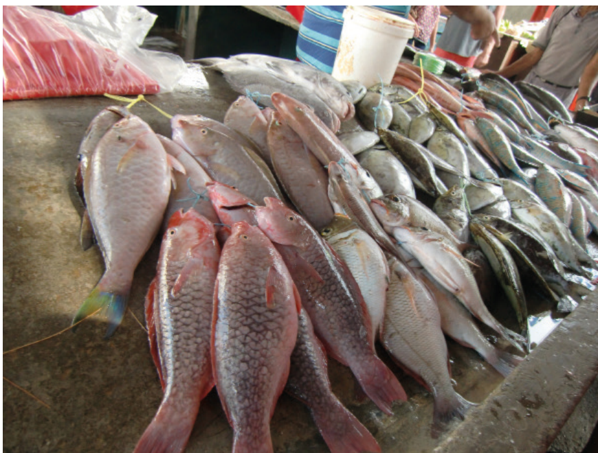
Färsk fisk till salu på Victoria Market i Seychellernas huvudstad Victoria.

Vi har i en nyligen publicerad studie även undersökt om MeHg ger epigenetiska (se faktaruta) förändringar, som kan fungera som ett långtidsminne i kroppen från fosterstadiet, under barndomen och i vuxen ålder. Detta är en av de första studierna som belyser de epigenetiska konsekvenserna av exponering för MeHg. Eftersom vi inte kan få vävnad från hjärnan, målorganet för MeHg, mätte vi epigenetiska förändringar i DNA i barnets saliv när de var 7 år. Saliv-DNA har samma ursprung som nervceller under tidig fosterutveckling. Vi valde tre gener som alla har visats vara förändrade efter MeHg-exponering i cell-försök och/eller är nyckelgener för vissa funktioner i nervsystemet.