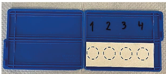
Foto ovan: Ett förbehandlat filterpapper placerat i sin filterkasset, färdigt för provtagning.

Avdelningen för Arbets- och miljömedicin